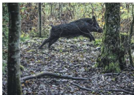
Vildsvin på väg. De ser kanske inte så smidiga ut med blotta ögat men att ta sig över såväl stock som sten och surhål var inga problem för vildsvinet i Reutersbergs vildsvinshägn.