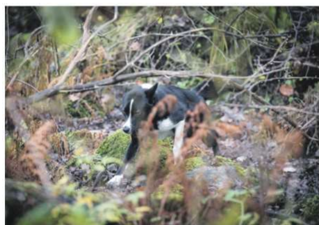
I träningshägnen för vildsvinshundar är det mest tät skog men det finns också en ekekulle och ett surhål som dagen till ära var rejält surt och lerigt. Inget av det störde dock hunden Åsebos Tilly nämnvärt.